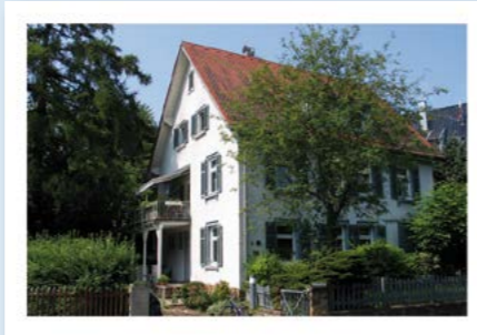
Steinstr. 4 - 74072 Heilbronn

8 teilmöblierte Einzelzimmer mit Kochnische werden für Obdachlose oder von Obdachlosigkeit bedrohte Personen ab 18 Jahren zum kurzfristigen Bezug angeboten.