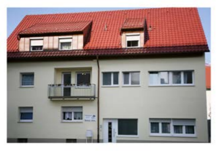
Weinsbergerstr. 5/3 - 74072 Heilbronn

Die Wohngemeinschaft ist eine anerkannte teilstationäre Einrichtung für Hilfen nach § 41 SGB VIII und §§ 67 ff. SGBXII. Diese Einrichtung ist bestimmt für 7 männliche Bewohner im Alter zwischen 18 und 27 Jahre und 3 weibliche Bewohnerinnen (keine Altersbegrenzung).